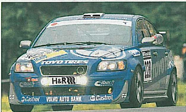
Ziel ist Sieg in der Klasse »alternative Kraftstoffe«.

des Volvo S40 T5, nun für den Betrieb mit Bio-Power modifiziert. BioFormula 85 ist ein E85-Qualitätskraftstoffgemisch und eignet sich für den Betrieb von FFV-Fahrzeugen (Flexible Fuel Vehicles). E85 weist einen Bioethanolanteil von 85% auf, welchem 15% Benzin beige-mischt ist. Durch Bioethanol als Benzinzusatz wird die Abhängigkeit von fossilen Brennstoffen gesenkt und die energie- und agrarpolitischen Ziele der EU unterstützt.