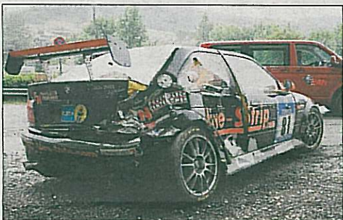
Mit diesem BMW M3 (ob.) verunglückte Ronny Melkus. Die Mechaniker machten den Flitzer wieder einigermaßen flott, damit er unter großem Jubel mit einem anderen Fahrer noch durchs Ziel fahren konnte. Unt.: Hans-Joachim Stuck war auch in den Regen-Crash verwickelt.