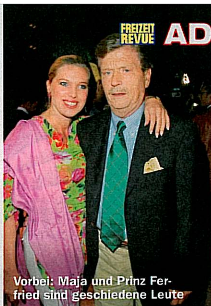
Vorbei: Maja und Prinz Ferfried sind geschiedene Leute